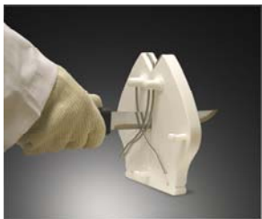
Montado en mesa

PRIMEEdge ® COZZINI CUTTING EDGES AND SHARPENING SOLUTIONS