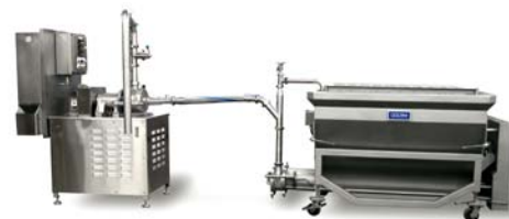
Система AR722 со шнековым загрузчиком