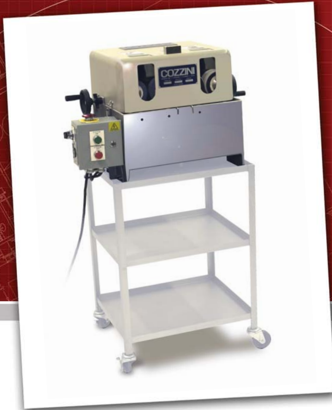
Vista con carrello opzionale.