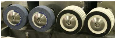
Pietre di molatura