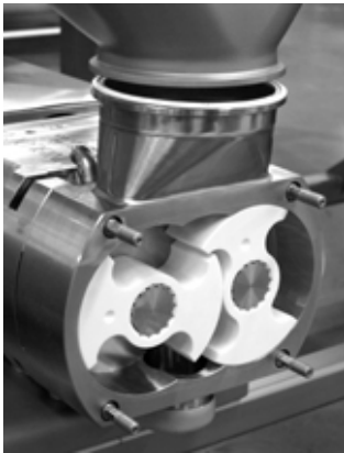
Abb.: Ausschnitt eines Pumpenrotors mit demontierter Abdeckung und Trichterkupplung