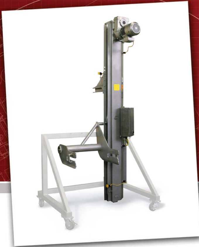
Abb. mit Sonderzubehör Transportsockel