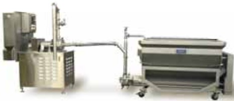
Système AR901MC présenté avec la vis sans fin

PrimeCut™ COZZINI EMULSION/REDUCTION SYSTEMS